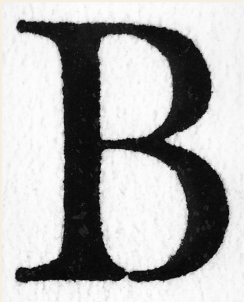
VON: HENDRIK VAN DEN KEERE (CA. 1540–1580)

DIE DTL VAN DEN KEERE WURDE NACH DEN HISTORISCHEN SCHNITTEN DES HENDRIK VAN DEN KEERE VON DER DUTCH TYPE LIBRARY 1991–95 GESTALTET UND AUSGEBAUT